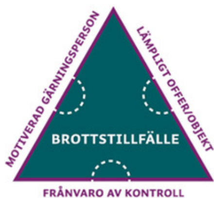
Brotstriangel situationella brott

Situationellt brottsförebyggande arbete handlar om att förhindra eller försvåra att brott begås genom att förändra den aktuella platsen eller situationen där brott kan begås. Brotstriangeln är ett stöd för att analysera en brottsproblematik och välja åtgärder.