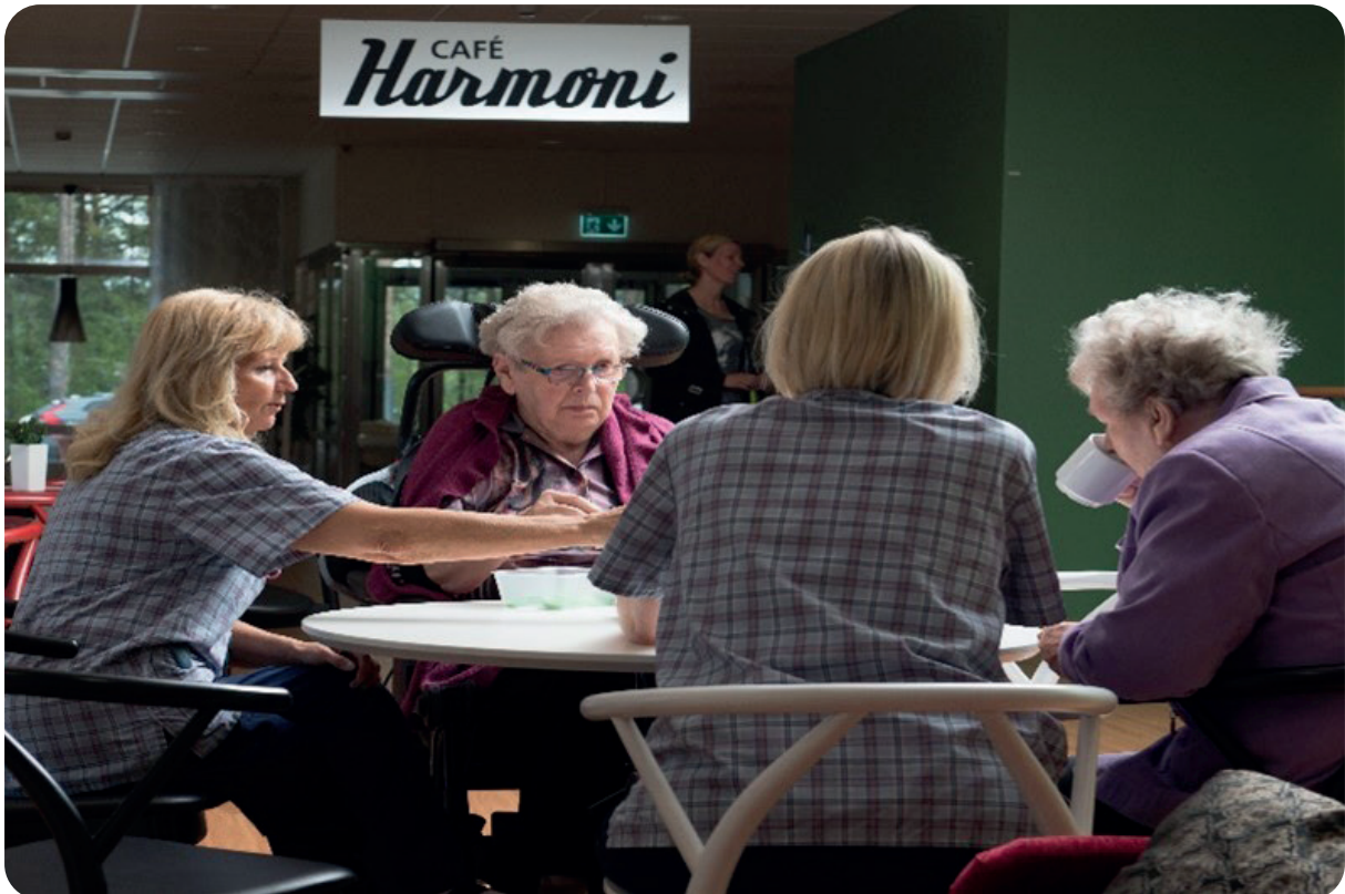
Bilden tagen år 2018 innan covid-19, därav används inte munskydd.

Engagerade medarbetare som har inflytande, tar ansvar, trivs och känner att de spelar roll i människors vardag bidrar mer till verksamhetens utveckling. De blir också engagerade ambassadörer för sitt yrke och förutsättningarna ökar att medarbetare vill stanna kvar och utvecklas på sin arbetsplats.