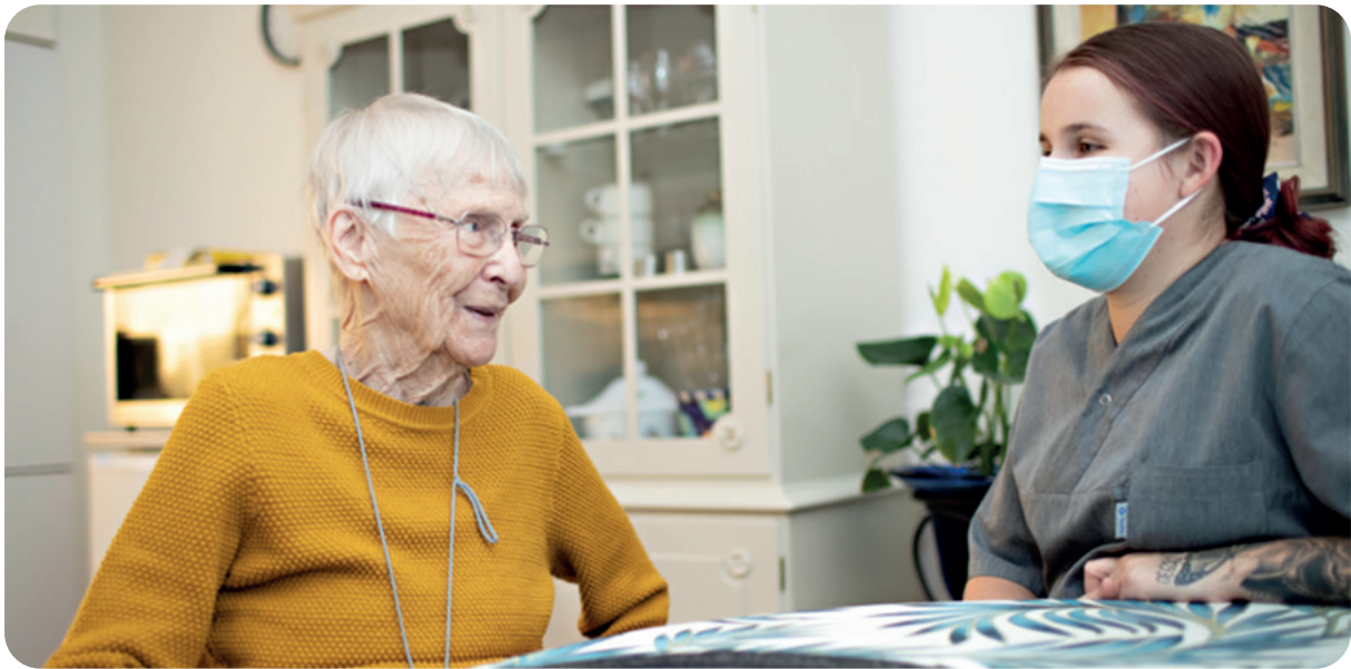
(Bilden tagen under pandemin covid-19, därav används munskydd).

Socialförvaltningens arbetssätt ska vara personcentrerat och flexibel utifrån den äldres behov. Vi ska arbeta hälsofrämjande och ta hänsyn till den enskildes hela livssituation, där den enskildes förmågor och resurser ska tas till vara och utvecklas så långt det är möjligt. På så sätt skapas förutsättningar och möjligheter till delaktighet och självbestämmande inom ramen för den äldre med stöd och insatser från kommunen. Bemötande har avgörande betydelse för vårdens och omsorgens kvalitet. Det är den enskildes viktigaste kvalitetsfaktor för hur äldre personer upplever vård och omsorg. Med bemötande avses det sociala växelspel som sker mellan personer i mötet. Bemötande innebär också medvetenhet om och förmåga till inlevelse i andra personers behov och reaktioner samt visad respekt för motparten.