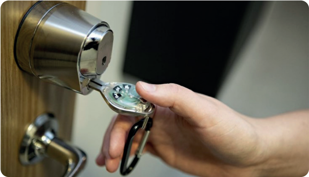
Digitalt nyckellås s.k. nyckelfrihemtjänst

Socialförvaltningen ska sträva efter att erbjuda och använda välfärdsteknologi som stöd i vård och omsorg av äldre personer.