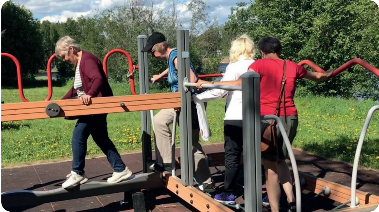
Fyren -Utegympa (Bilden tagen innan pandemin covid-19, därav används inte munskydd).

Begreppet hälsosamt åldrande omfattar både hälsa och välbefinnande, där livsstilsfaktorer och psykosociala faktorer är viktiga. Individens förmåga och möjligheter att planera, styra och följa upp sitt liv är av betydelse för ett hälsosamt och "framgångsrikt" åldrande.