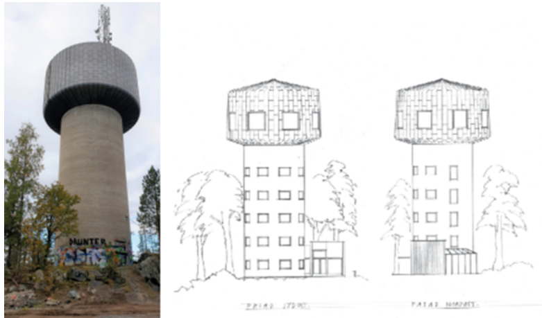
Figur 2. Befintligt vattentorn (t.v.) och illustration som visar möjliga exteriöra ändringar av tornet såsom tillbyggnad av entré (t.h.). Illustration: Tage Isaksson Arkitektkontor AB.

tornet. De förslagsskisser som framtagits under planarbetet visar på en kubformad entrébyggnad med fasader i lärk i stående träpanel kompletterat med fasader i glas. Dörr- och fönsterpartier är tänkta att utformas med aluminium och koppar. Inom planområdet kommer också en komplementbyggnad att uppföras om ca 50 kvm i form av förråd och miljöhus för avfallshantering samt ytor för parkering.