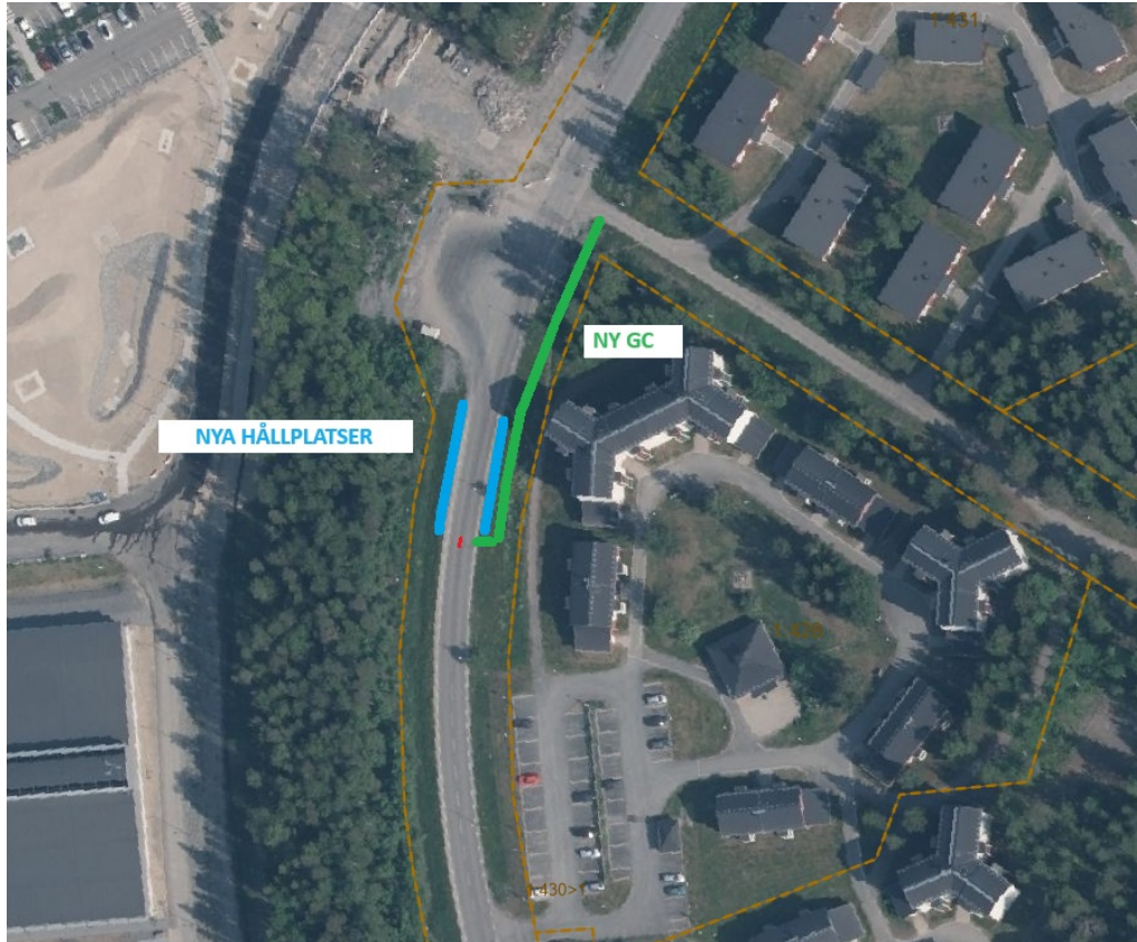
Bild 2: Åtgärd ny gång- och cykelväg (GC) efter Vänortsvägen. Det gröna strecket är ny GC och de blå strecken markerar de två busshållplatslägena som byggs om i projekt "Tillgänglighetsanpassning Busshållplatser". Cykelvägen är en del av en utpekad sträcka i kommunens cykelplan.

årets arbete. I och med att busshållplatsen samt gång- och cykelvägen byggs samtidigt uppnås samordningsvinster med en entreprenör och en etablering.